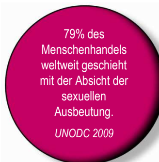
Dimensionen krimineller Aktivitäten weltweit